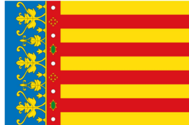
LA COMUNIDAD VALENCIANA