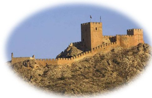
CASTILLO DE SAN FERNANDO (Alicante)