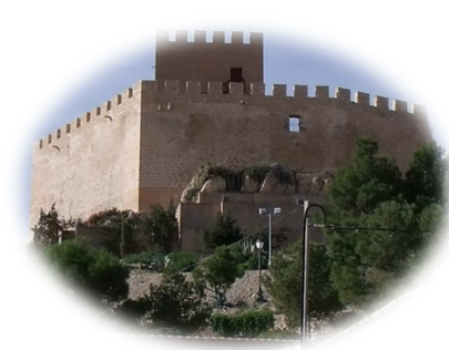
CASTILLO DE VILLENA (Villena)