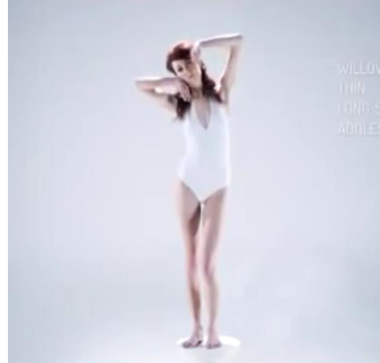
2 Años sesenta