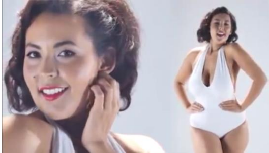
1 Años treinta a cincuenta