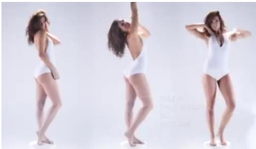
3 A partir de los ochenta