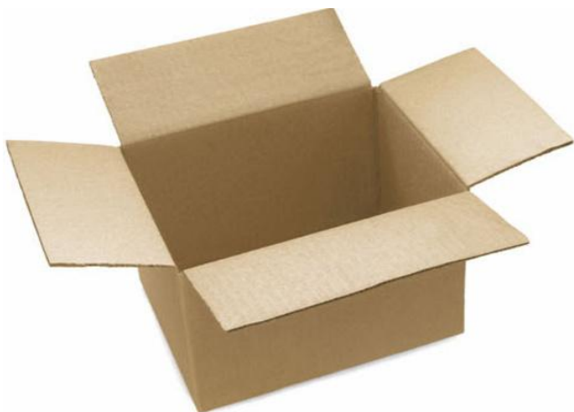
Una caja de cartón