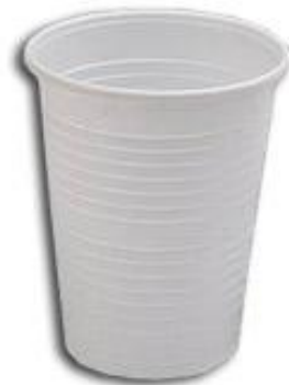
Un vaso de plástico