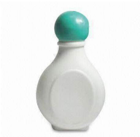
Un bote de champú