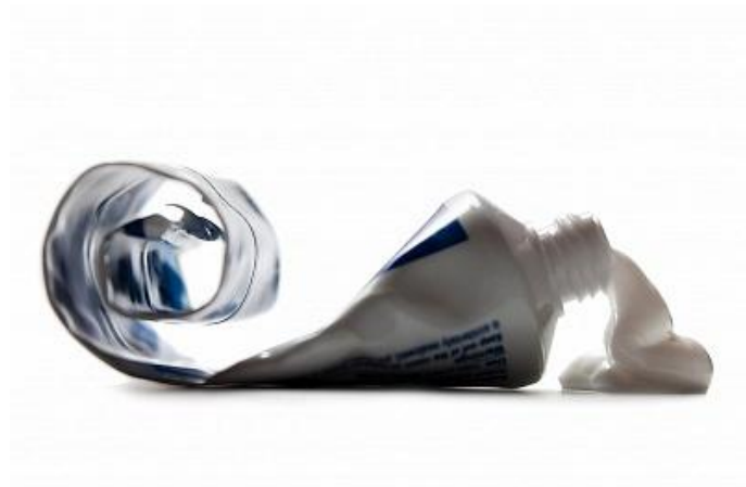
Un tubo de pasta de dientes