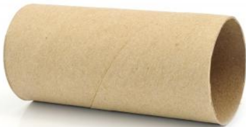
Un rollo de papel higiénico