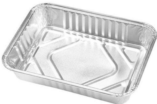
Una bandeja de aluminio