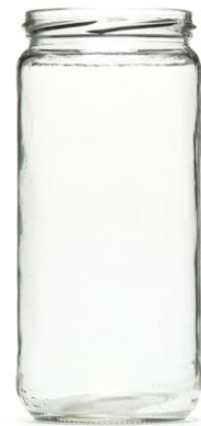
Un bote de cristal