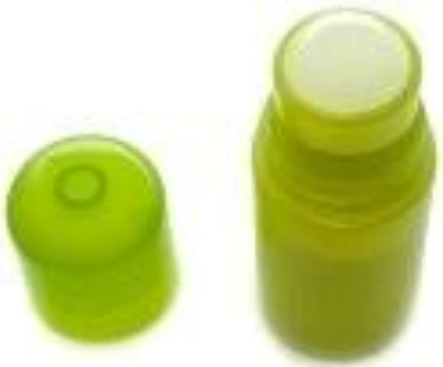
Un desodorante de plástico