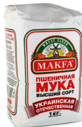
Un paquete de harina