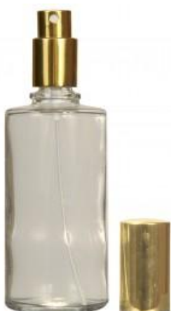
Un frasco de perfume