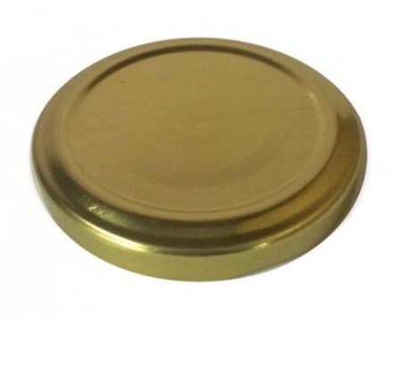
Una tapa metálica