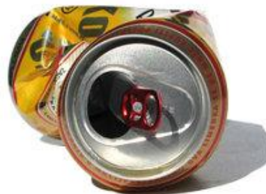
Una lata de cerveza