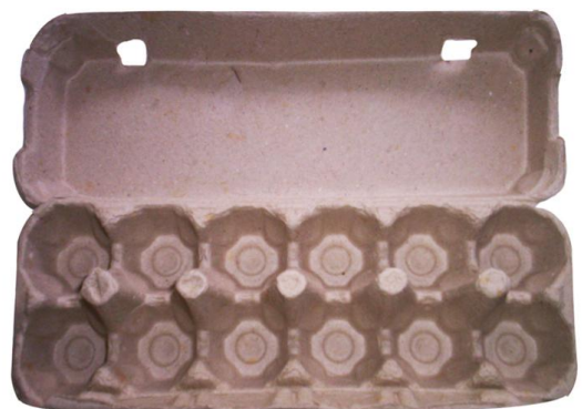
Un cartón de huevos