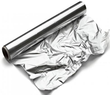
Papel de aluminio