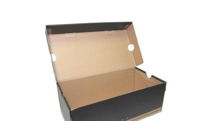
Una caja de zapatos