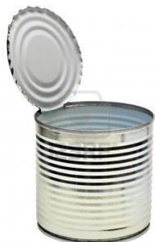
Una lata de conserva