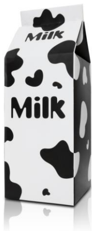
Un brik de leche