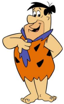
PEDRO PICA PIEDRAS