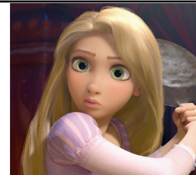
Rapunzel (Ruiponce o Rapónchigo)