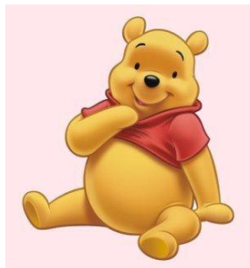
EL OSO POOH