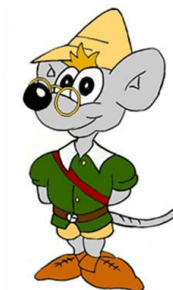
EL RATONCITO PÉREZ