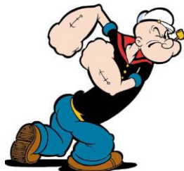
POPEYE EL MARINERO