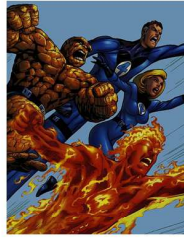
Los Cuatro Fantásticos