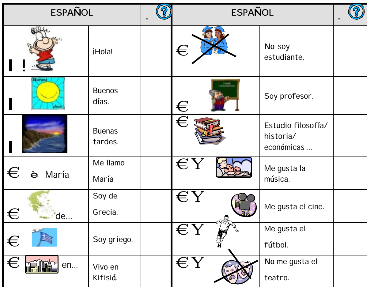
Ficha 1: Información personal básica