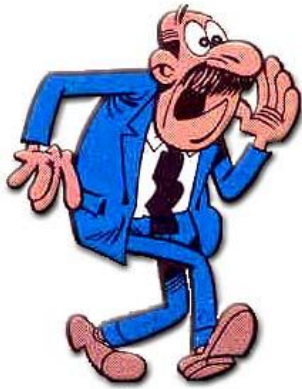
El superintendente (El súper)

Es el jefe de Mortadelo en la T.I.A, siempre está enfadado y gritando. Tiene tan mala suerte que todas las desgracias le ocurren a él.