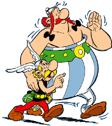
Asterix y Obelix

Son una pareja de Galos invencibles gracias a una poción mágica que les prepara su druida. Asterix es muy alegre y Obelix un comilón, su plato preferido es el jabalí.