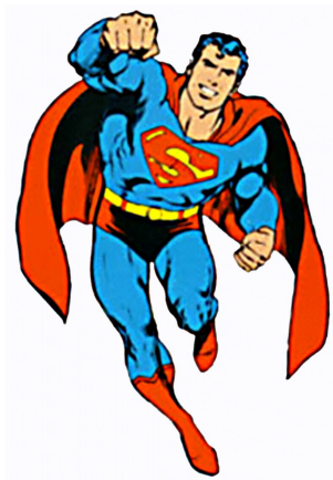
Superman- Clark Kent

Es una chica muy inteligente y sociable, con todo tipo de poderes psíquicos.