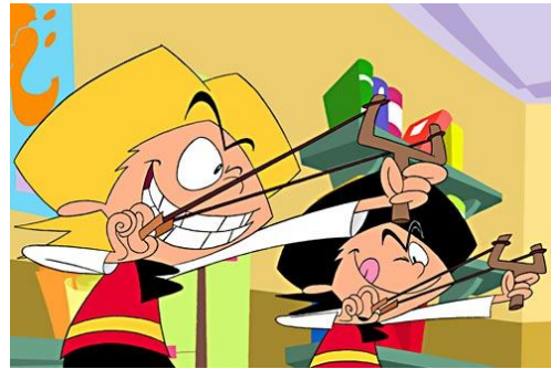
Zipi y Zape

Es agente secreto en la T.I.A., todo un experto en disfraces. Su compañero es Filemón, y siempre le acompaña.