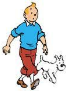
Tintín y Milú

Es el jefe de Mortadelo en la T.I.A, siempre está enfadado y gritando. Tiene tan mala suerte que todas las desgracias le ocurren a él.