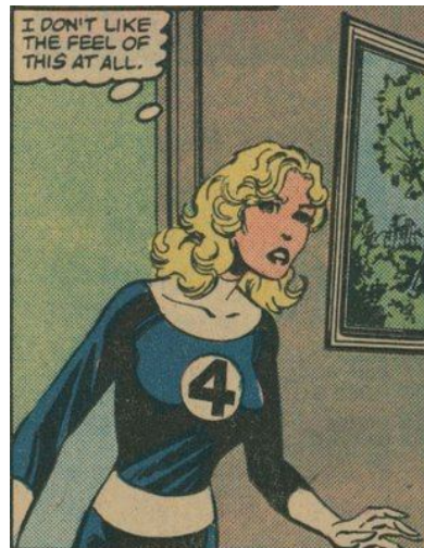
Sue Storm – La chica invisible

Cuando es Superman es la persona más fuerte del mundo, con una vista genial y muy rápido. Cuando es Clark Kent, es inseguro y muy tímido, además de torpe.